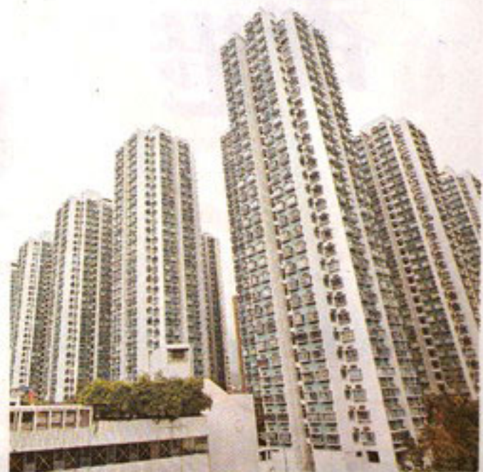
■ 預期八號幹線正式通車後，將帶動沙田區樓價有一成的升幅。