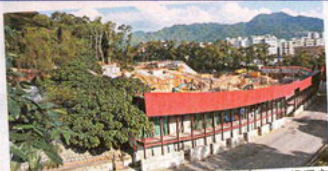
■ 同區新盤嘉御山提供三種特色分層單位及八幢獨立洋房，預計明年第三季落成。

踏入三月，樓市氣氛有了一百八十度的轉變，一手新盤成交更創下今年新高。由嘉華發展的新盤沙田嘉御山，看準政府大型基建項目八號幹線即將落成，乘勢推出市場絕無僅有的超豪分層「巨無霸」大單位，勢將成為區內新一代豪宅指標。